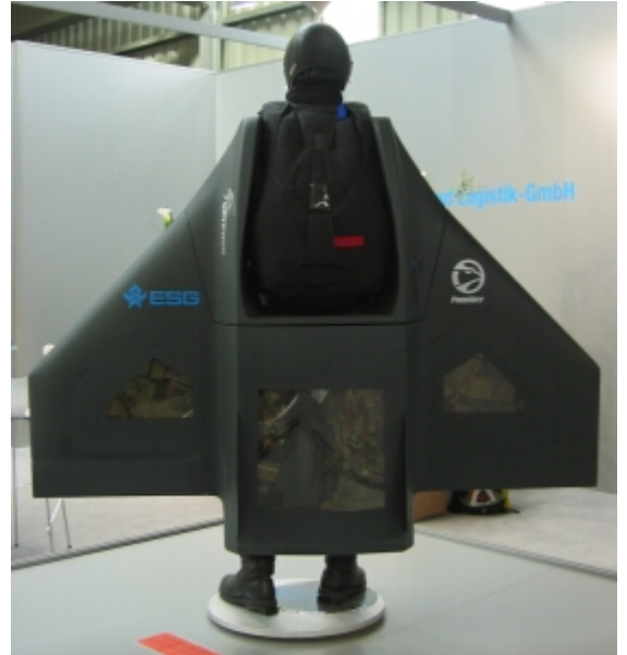
Paracaidista equipado con "Gryphon"

¿Pudo ser algo semejante a esto lo que vieron antaño unas personas que ignoraban por completo la existencia de una simple tuerca o tornillo?