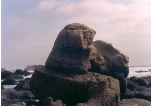
Megalito con rostro de aborigen. Se apoya sobre una superficie pétreo rectangular