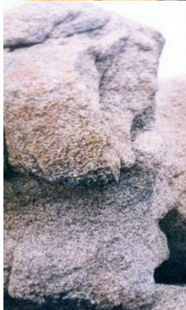
Detalle del perfil. En la fotografía el rostro mira hacia la derecha.