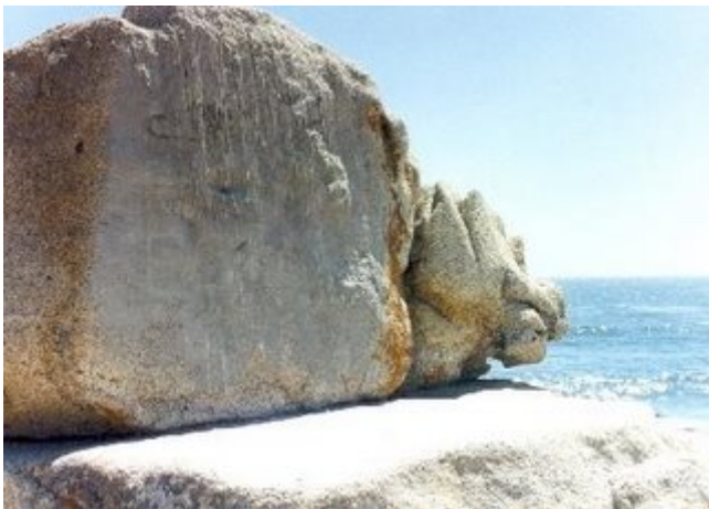
Detalle del objeto señalado precedentemente. El rostro es evidente, incluso se percibe muy bien la boca y algo semejante a escamas. Esta pieza ha sido instalada sobre la superficie que se aprecia en la fotografía previa a la anterior.