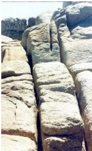
Masas de piedra cortadas con precisión.