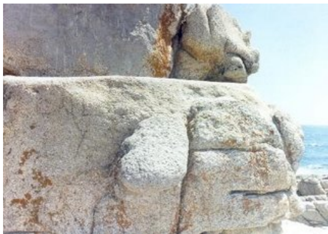
Otra toma del monolito con forma de dragón.