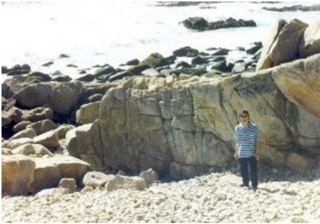
El autor delante del muro de piedra

El centro megalítico de El Quisco no sólo está compuesto por representaciones humanas y de animales sino que además por algunas construcciones de orden arquitectónico como un muro y escalas pétreas de pocos peldaños (a diferencia del muro que como puede apreciarse en la fotografía que se acompaña es de envergadura notable).