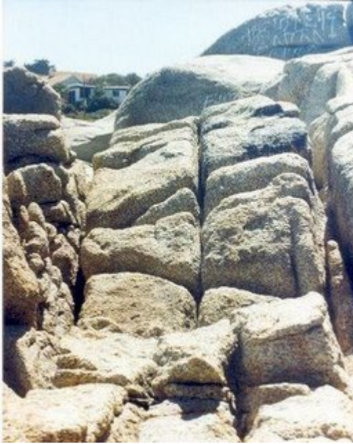
Más piedras cortadas rectangularmente