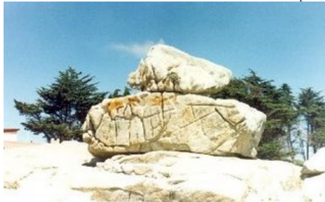
Inmenso megalito, compuesto por dos rocas, cuyas formas precisas parecen haberse perdido por la acción del viento.