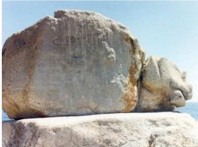
El megalito representaría a un dragón u otro ser fantástico.