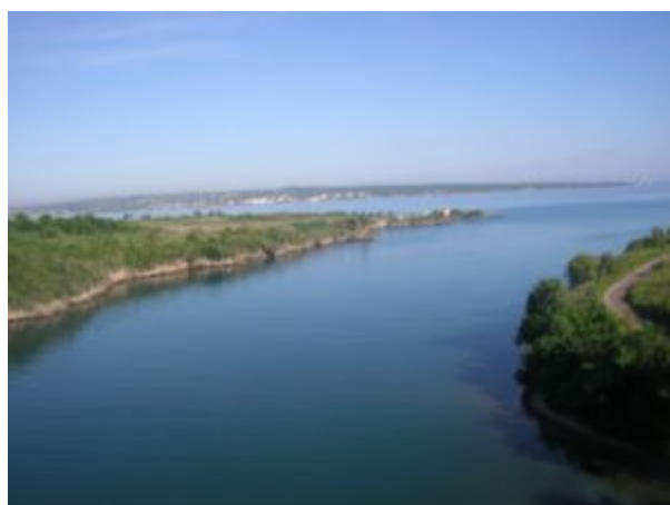
Desembocadura río Canímar

En la desembocadura se localiza el mayor y más importante asentamiento agro alfarero de toda la provincia, denominado “El Morrillo”, por ubicarse a solo cien metros del fuerte colonial de igual denominación.