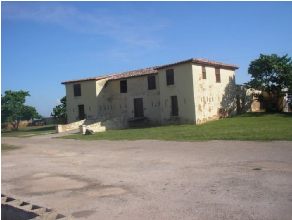
"Museo - Memorial "El Morrillo"