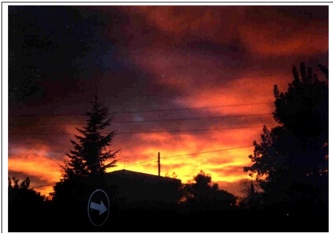
Fig. 9. Atractiva puesta de Sol desde La Eliana (Valencia), 1 de octubre de 1989.