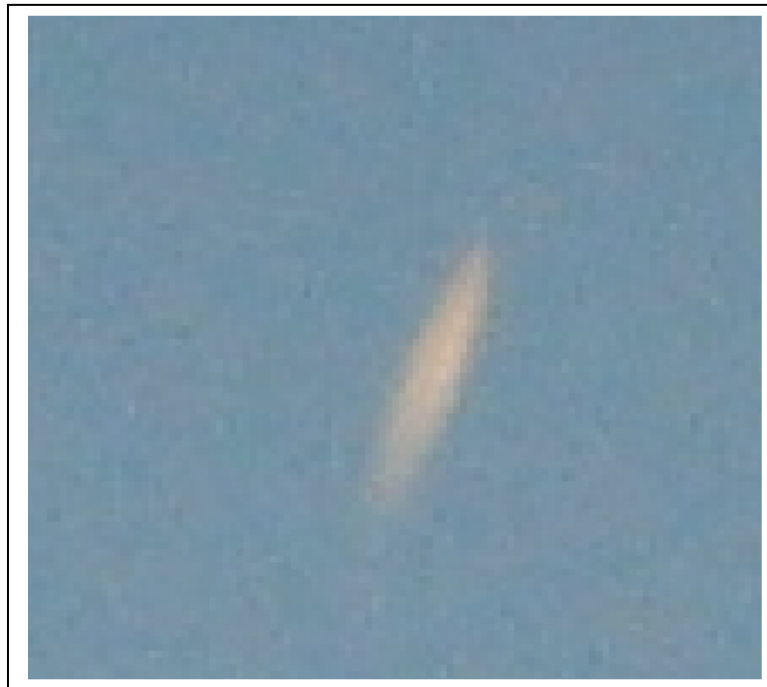
Fig. 3. Ampliación del haz de luz.

Si hacemos un poco de ufología comparada, y echando mano primeramente a un ejemplo extraído de mi último libro (2), vemos un fotograma extraído de una filmación de video hecha en una población de Noruega donde observamos que la apariencia de lo grabado se asemeja bastante a nuestra foto levantina. La causa de la imagen en este caso noruego fue la estela de condensación producida por un avión durante un atardecer, cuando adquieren tintes muy coloristas.