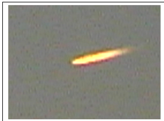
Fig. 4. Asker (Noruega), 19/11/2002.

Otros casos muy parecidos los hallamos, por ejemplo, en la casuística de Chile, un país en el que nuestro Proyecto FOTOCAT ( http://fotocat.blogspot.com/ ) ha podido profundizar extraordinariamente en cuanto a recopilar información gráfica de presuntos avistamientos OVNI. De nuestros archivos, pues, sacamos imágenes de tres videos conseguidos –todos