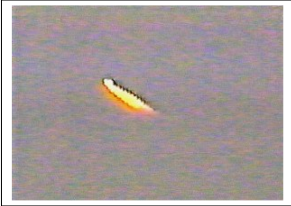
Fig. 5. El Tabo (Chile), 17/2/2000.