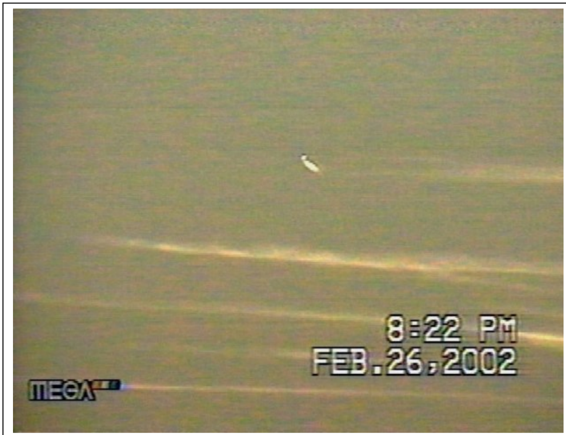
Fig. 7. Quintero (Chile), 26/2/2002.

Y aquí mostramos una ampliación de la imagen aparentemente extraña: