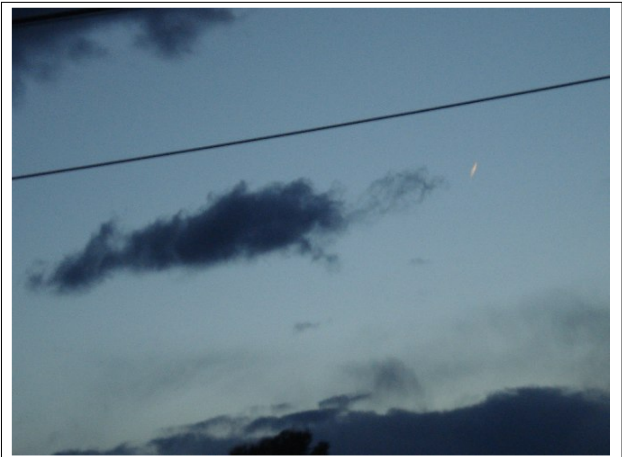
Fig. 2.

La fotografía en sí es poco impresionante. Es el testimonio de los testigos, sobre todo de su portavoz, Dora, persona de toda confianza, que incluye la aparición de un fragmento luminoso que se desgaja de la estela y desaparece velozmente, lo que añade extrañeza al avistamiento, ya que al haber tres testigos -que permanecieron atentos al fenómeno durante toda su extensión- podemos tener la seguridad de su realidad (cosa diferente es que siempre pueden darse efectos de percepción u ópticos engañosos que hagan imprecisas las observaciones).