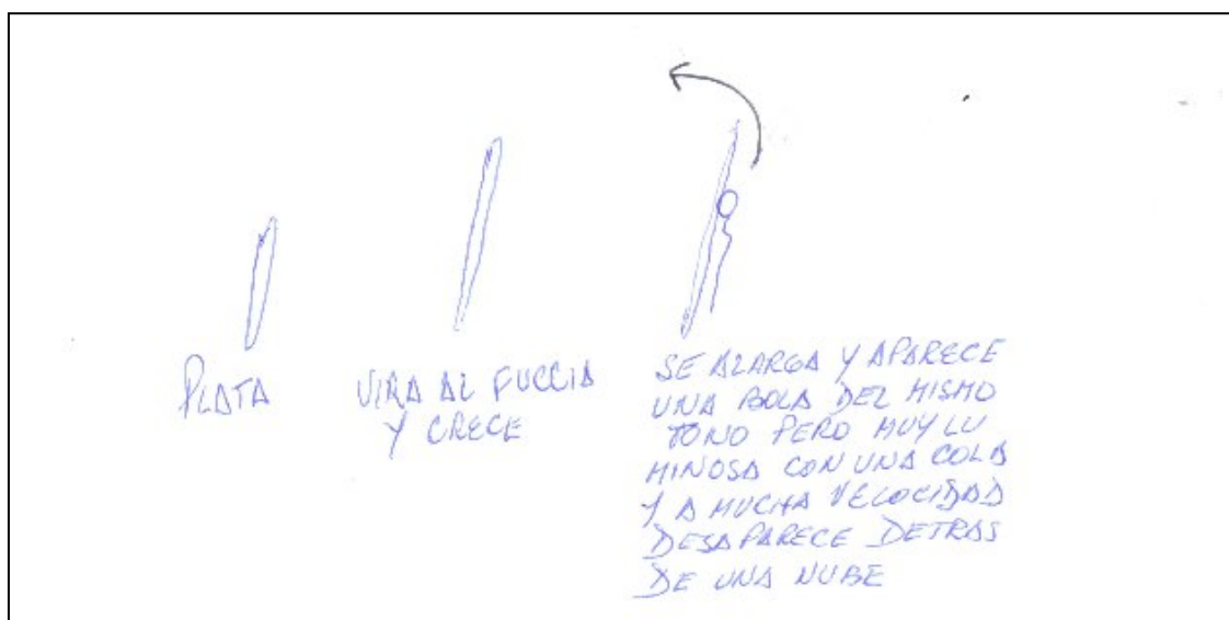
Fig. 1. Dibujo de las etapas del avistamiento, según Dora D'Amico.

Se trataba de un “haz” largo de color plata brillante, situada a unos 45º de elevación, que fue virando al fucsia y haciéndose más alargado. Siguió extendiéndose y, en un momento determinado, se desprendió de la parte central de dicho haz una bola del mismo color pero muy luminosa, dotada de una cierta cola (“como su fuera un espermatozoide”) que se movió a mucha velocidad y desapareció detrás de una nube a su izquierda, hasta entonces de color gris oscura, la cual comenzó a adquirir la misma tonalidad fucsia. Al tiempo, dejaron de ver la estela (o bien desapareció o bien dejaron de prestarle atención, al fijarse más en el cambio de coloración de la nube). Todo fue observado desde el interior del automóvil en marcha.