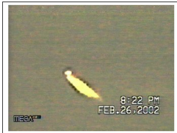
Fig. 8. Detalle.

Expertos locales han identificado las trazas luminosas de los tres episodios anteriores como debidas al reflejo solar en la estela de vapor de aeronaves convencionales, naturalmente. En las tres ocasiones, la hora era pareja a la del avistamiento español y sucedieron en sendos atardeceres.