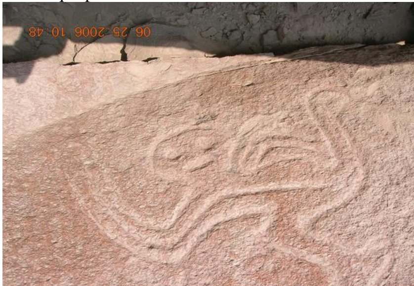
Extraño humanoide parece estar corriendo