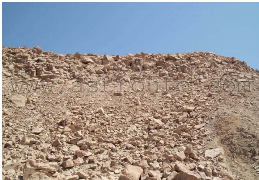
Decenas de petroglifos esparcidos en las partes altas de los cerros

Los dibujos hechos en la parte plana de piedras volcánicas, están diseminados sobre las laderas de tres cerros contiguos a los que es posible ascender con dificultad, y en cuyas cumbres se aprecian posibles centros ceremoniales desde donde se observa el valle palpeño. Es precisamente la dificultad para su ascenso lo que lleva a los investigadores a la conclusión de que se trataba de un lugar sagrado.