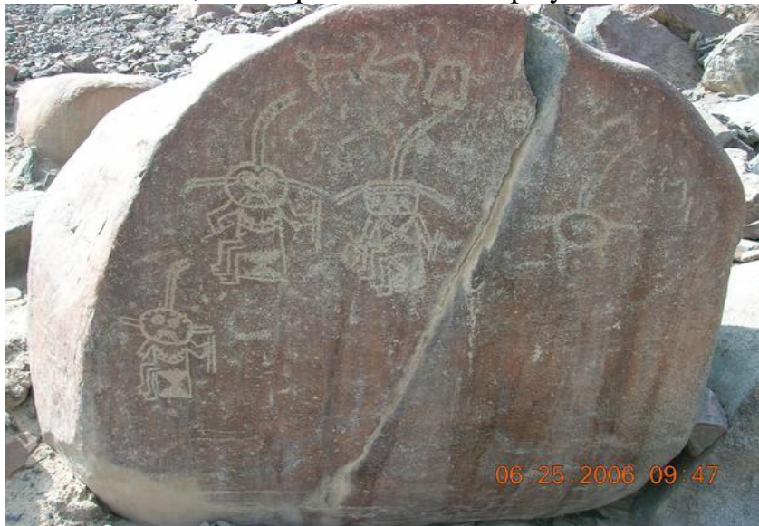
Etapas de la Vida: Niño, adulto, anciano y un símbolo divino posterior a la muerte.

En Chichictara se pueden encontrar piedras grabadas con diferentes diseños que representaban las manifestaciones artísticas, culturales, religiosas y demás de los antiguos pobladores de Palpa. Chichictara es un verdadero emporio de petroglifos, entre los que figuran serpientes bicéfalas, el sol, la luna, animales, figuras con rasgos antropomorfos, aves y representaciones diversas.