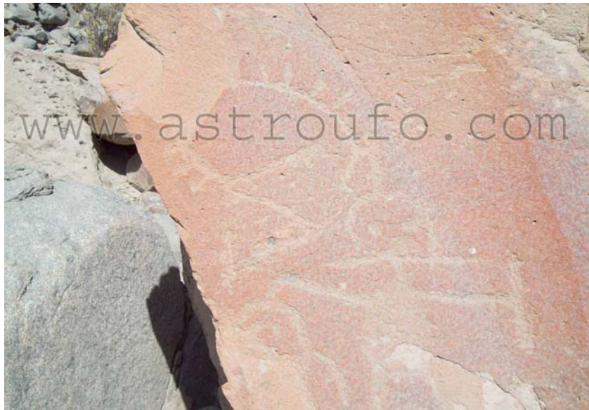
Otro petroglifo con presencia de humanoides