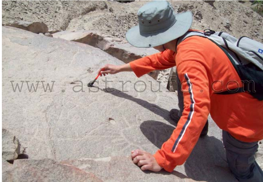
Servidor examinando uno de los tantos petroglifos de la zona

Los dibujos hechos en la parte plana de piedras volcánicas, están diseminados sobre las laderas de tres cerros contiguos a los que es posible ascender con dificultad, y en cuyas cumbres se aprecian posibles centros ceremoniales desde donde se observa el valle palpeño. Es precisamente la dificultad para su ascenso lo que lleva a los investigadores a la conclusión de que se trataba de un lugar sagrado.