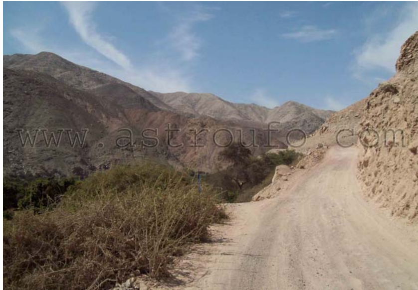
Camino a Chichictara, a la izquierda el río Palpa y a la derecha los cerros

Son unos tres kilómetros donde reposan decenas de petroglifos de más de dos mil años de antigüedad, en los cerros ubicados en el margen derecha del río Palpa. Empieza este recorrido con el petroglifo conocido como Las Etapas de la Vida, una de las tantas figuras enigmáticas, donde presenta al personaje más anciano con tres piernas.