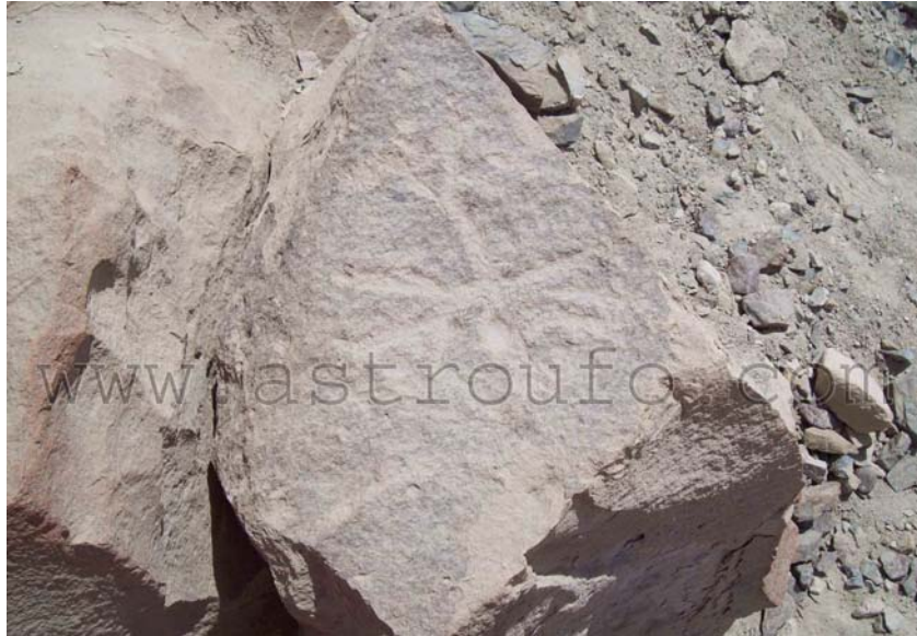
Lo que parece ser un insecto retratado en otra roca