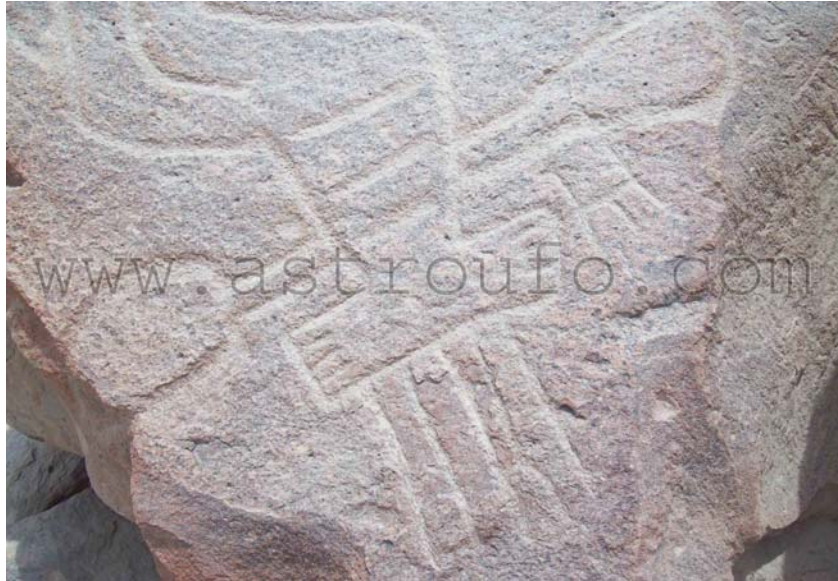
Labrado similar a los geoglifos de Nasca y Palpa