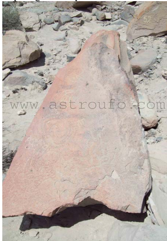
Escena labrada en otro petroglifo

Se presume fueron realizadas por hombres de la cultura Nasca, Paracas y Wari aproximadamente en el periodo comprendido entre los años 800 y 200 a.c. pudiendo contabilizarse hoy en día más de 1.200 diseños reconocibles, muchos de los cuales han ido perdiéndose debido a la erosión de las rocas y el paso del tiempo.