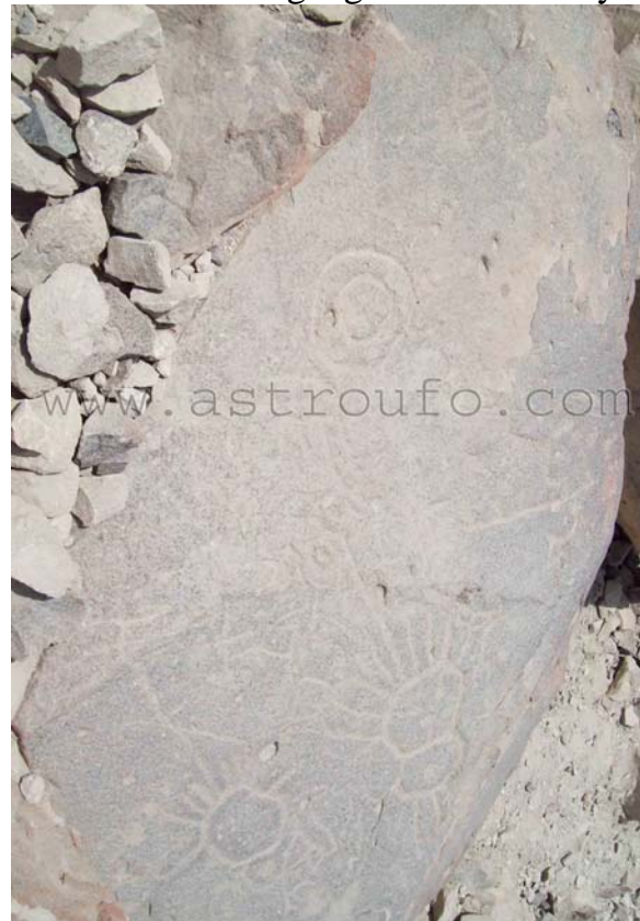
Dos seres humanoides en tierra y arriba en el cielo lo que parece ser el sol junto a otro objeto