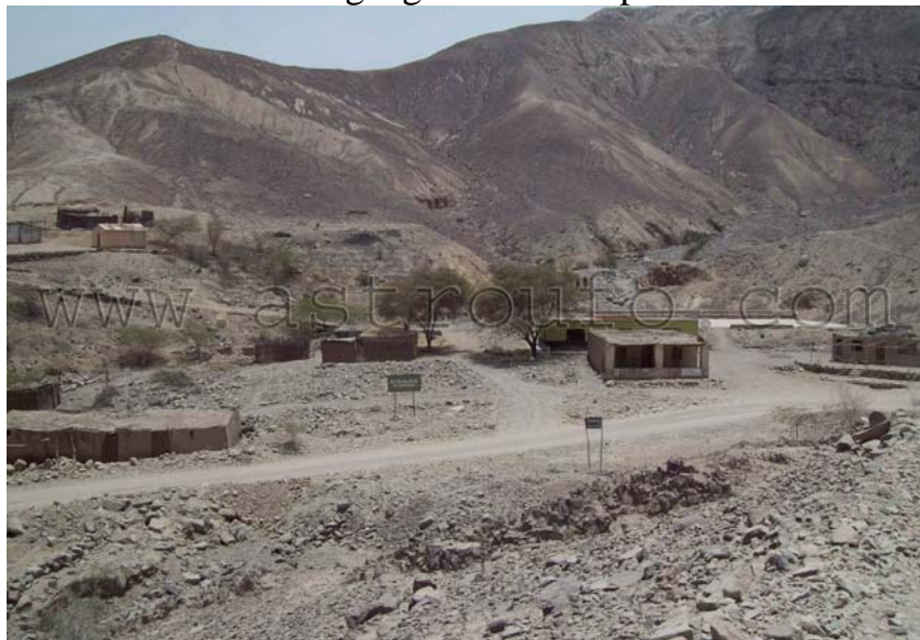
Vista panorámica de una parte de la zona de Chichictara