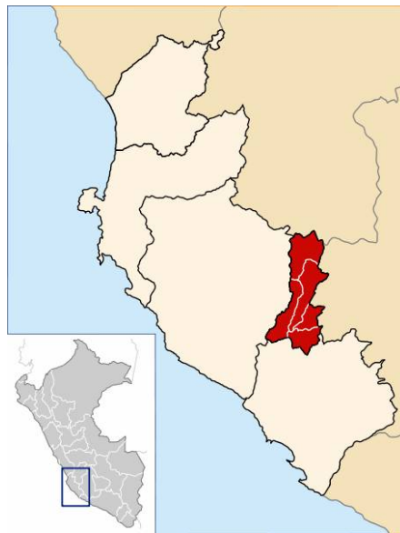
Ubicación geográfica de Palpa - Perú

A unos 10 Km. al noreste de la localidad de Palpa-Perú (ubicada a 400 Km. al sur de Lima), se encuentran unos enigmáticos dibujos labrados en rocas conocidos como los Petroglifos de Chichictara. El termino Chichictara en quechua quiere decir “lluvia de arena”, estos petroglifos están distribuidos en tres sectores, plasmados sobre rocas volcánicas y aluviales, donde existen imágenes de humanoides, guerreros, felinos, aves, camarones, serpientes, monos entre otros.