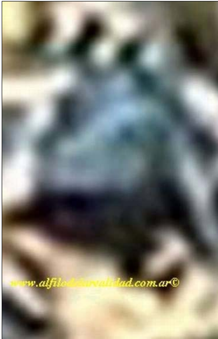
Ampliación del rostro de la entidad