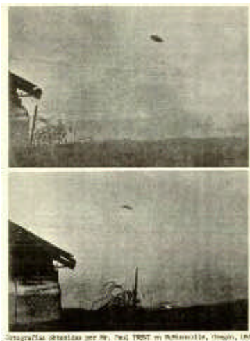
Fotografías obtenidas por Paul Trent en McMinnville, Oregon, EEUU.

realmente un aparato discoidal de naturaleza desconocida. Por el contrario, si el análisis de los datos arriba a un resultado negativo, el OVNI deberá ser considerado como un modelo en escala reducida, de menos de veinte centímetros de diámetro.