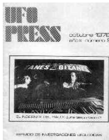
Revista "Ufo Press" Nº 9- Octubre de 1978