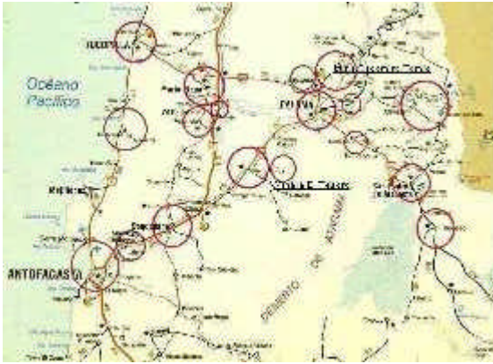
Mapa de Calama (ubicación geográfica de los ataques del Chupacabras). Gentileza de Jaime Ferrer de "Calama Ufo Center" y Liliana Núñez O.

Y por esta razón el Servicio Agrícola y Ganadero (SAG), decidió eliminar a 40 de esos perros, sin tener hasta la fecha la certeza absoluta de que fueran culpables de esas terribles matanzas.