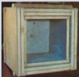
Cámara Orgónica de Wilhelm Reich

En cuanto a la explicación que puede tener esa emisión de energía que parece estar en la base de las líneas ley, una de las teorías más originales es la que conecta la fuerza telúrica con el "orgón" que el psicoanalista heterodoxo Wilhelm Reich aseguró haber "aislado" como fuerza pura, subatómica y primaria. Construyó una "cámara orgónica" construida a base de capas alternadas de materia orgánica e inorgánica, en el interior de la cual la energía del orgón se intensificaba siguiendo un esquema en espiral. Si una persona se sometía a la irradiación en una cámara orgónica –aseguraba Reich– la energía bloqueada de su cuerpo volvía a fluir, revitalizando el sistema nervioso.