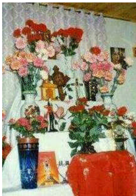
Otra vista del altar. Arriba, al centro, la pequeña y centenaria

San La Muerte. Señor de la Buena Muerte. Señor de la Paciencia. San La Paciencia. Señor La Muerte. San Justo Nuestro Señor de la Muerte. Nuestro Señor de Dios y la Muerte. San Esqueleto. Señor Que Lo Puede Todo. San Severo de la Muerte. O San, simplemente. Distintas denominaciones para una misma entidad arquetípica que –huelga decirlo– es sólo “santo” en la mentalidad simple pero profunda del pueblo, pues no lo registra el santoral católico. Cubierto con una capa negra y guadaña, con guadaña y sin capa, o en la versión más sugestiva de un esqueleto acuclillado y con las manos sosteniendo la barbilla, este payé o amuleto debe estar hecho preferentemente de plomo –mejor aún si es de la bala que mató o hirió a algún ser humano–, de hueso humano, o, en su defecto, madera o yeso. No debe tener más de quince centímetros de altura y si los sobrepasa, el altar que lo guarde no debe estar expuesto a miradas indiscretas.