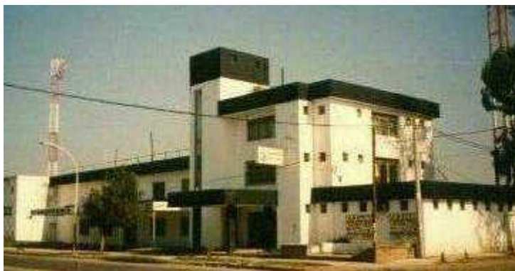
Edificio del club de fútbol "Chaco for Ever" con los colores típicos de San La Muerte: negro y blanco