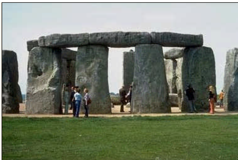
Megalitos de Stonehenge, Gran Bretaña