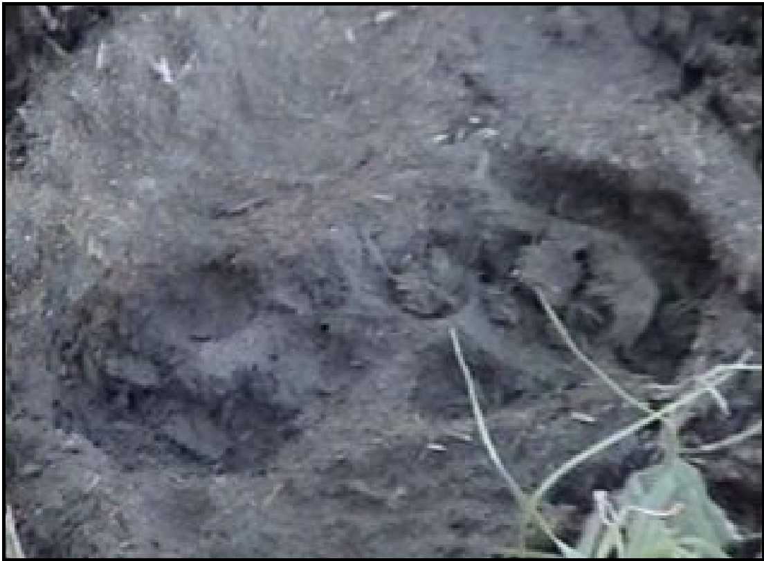
La huella de referencia

tratado en extenso en numerosos trabajos y no pienso plagiarme a mí mismo. Pero permítanme referirme a un episodio puntual que he investigado personalmente.