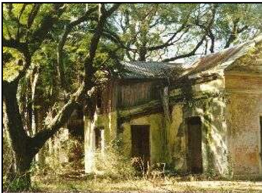
La casa solariega de los Tezanos Pinto