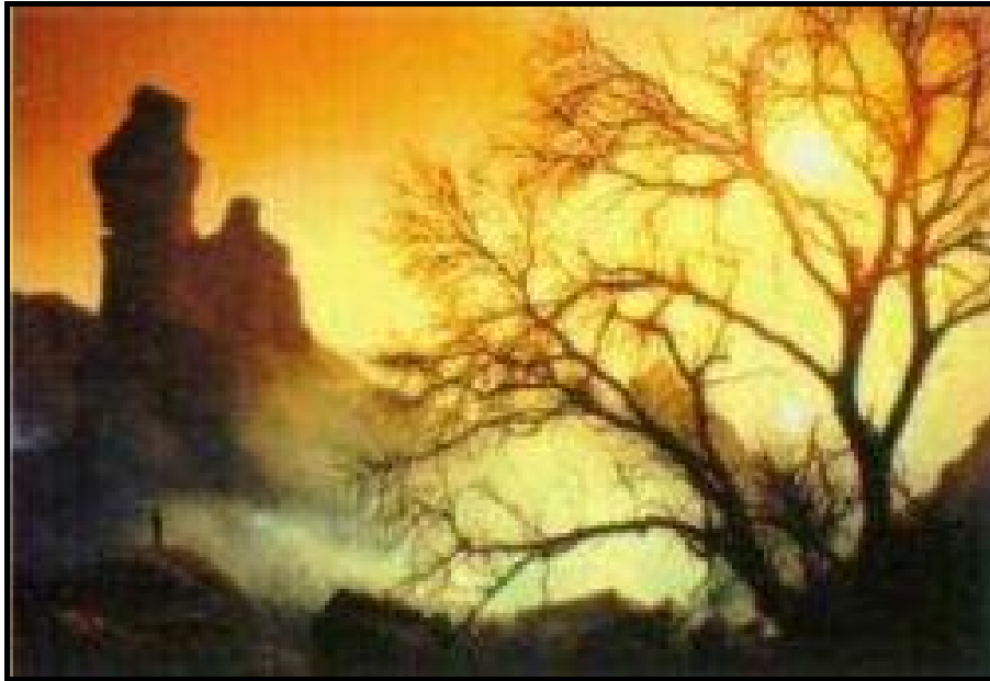
Los Terrones, el otro gran punto energético de la zona

Sin embargo, lo realmente asombroso —y que explica muchos fenómenos significativos casi cotidianos con el diario convivir de la gente de esa ciudad— fue descubrir que la propia ciudad de Capilla del Monte está construida sobre un “foco” energético muy particular, caracterizado por dos triángulos colindantes de fuerzas, donde sus vértices se caracterizan por ser verdaderos “faros” de energía telúrica.