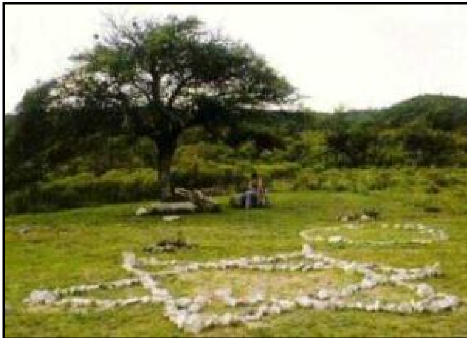
La "Posta del Silencio"