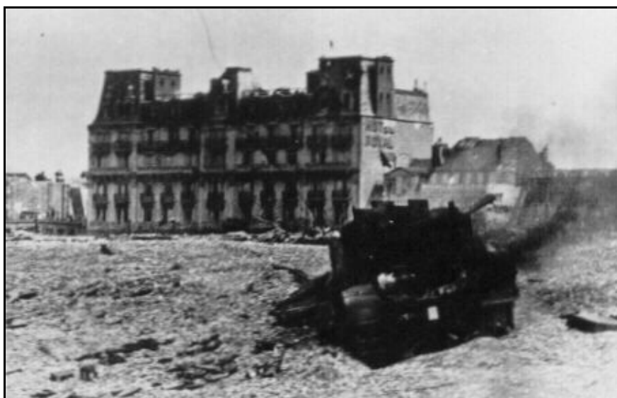
Dieppe durante el asedio

Los investigadores G. W. Lambert y K. Gay , de la Society for Psychical Research , establecieron un cuadro detallado en el que comparaban el relato y las observaciones de las dos mujeres con lo sucedido durante la incursión sobre Dieppe. Los acontecimientos del 19 de agosto de 1942 comenzaron a las 3:47 de la madrugada. La “hora cero” para el desembarco de carros de combate en Puy y Berneval tendría que haber sido a las 4:50, pero se produjo una demora. La primera ola de barcas llegó a Puy a las 5:07, y a las 5:12 los destructores habían comenzado a bombardear Dieppe. La fuerza principal desembarcó a las 5:20. Los edificios de la costa ya estaban siendo atacados por los Hurricane de la RAF que llegaron a las 5:15. A las 5:40 terminó el bombardeo. Exactamente diez minutos después llegaron 48 aviones más de la RAF y se unieron a la batalla. Estos detalles cronológicos fueron tomados por Lambert y Gay de un relato de la incursión totalmente desconocido por las dos mujeres.